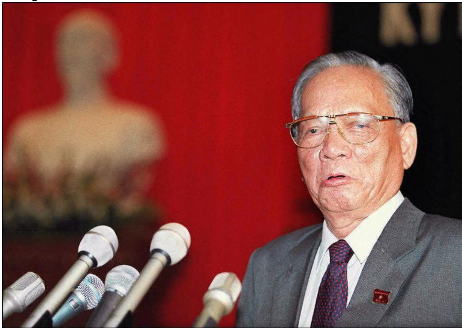
Tướng Lê Đức Anh thời còn là Chủ tịch nước năm 1997.