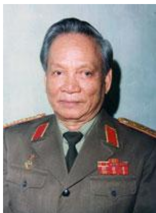
Đại Tướng Lê Đức Anh.