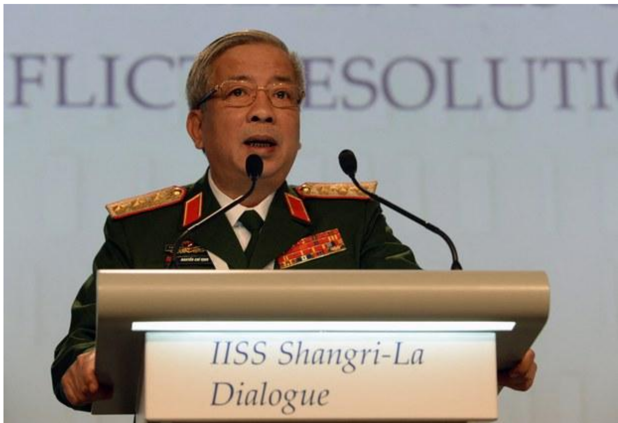
Thứ trưởng Quốc phòng Nguyễn Chí Vịnh phát biểu tại Đối thoại Shangri-La ở Singapore hôm 5/6/2016 (minh hoạ).

Đời binh nghiệp luôn là niềm tự hào và là những trang đẹp nhất đối với các đảng nam nhi khi phụng sự Tổ quốc. Năm Vịnh thì khác, Vịnh luôn chọn lối đi riêng, trải đầy bông lộc, quyền lực cho bản thân, gia đình và phe nhóm. Nhưng Luật Trời khắc nghiệt và công bằng. Khi anh không vì quốc gia, dân tộc, lại bán linh hồn cho quỷ dữ và ngoại bang, thì cái giá phải trả sẽ không hề rẻ chút nào (1). -----