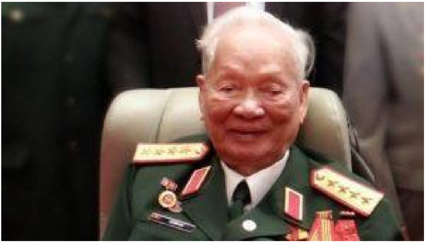
Ảnh: Tướng Lê Đức Anh.