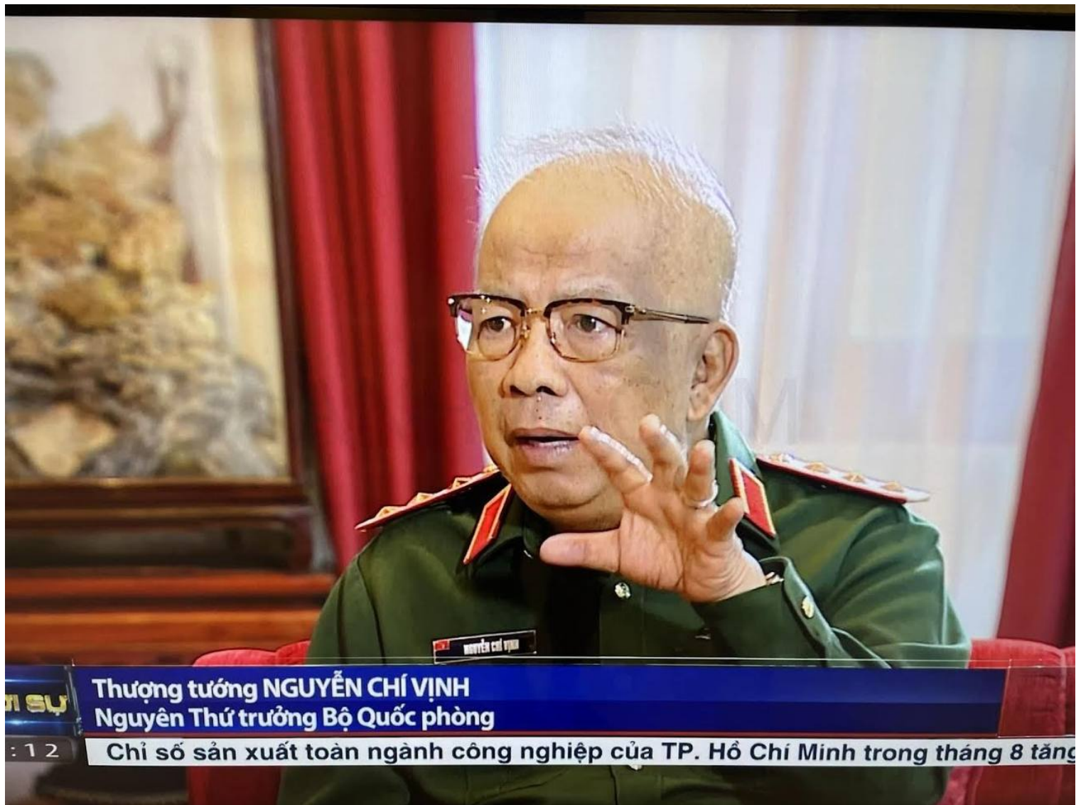
Nguyễn Chí Vịnh xuất hiện trên VTV sau khi mắc bệnh