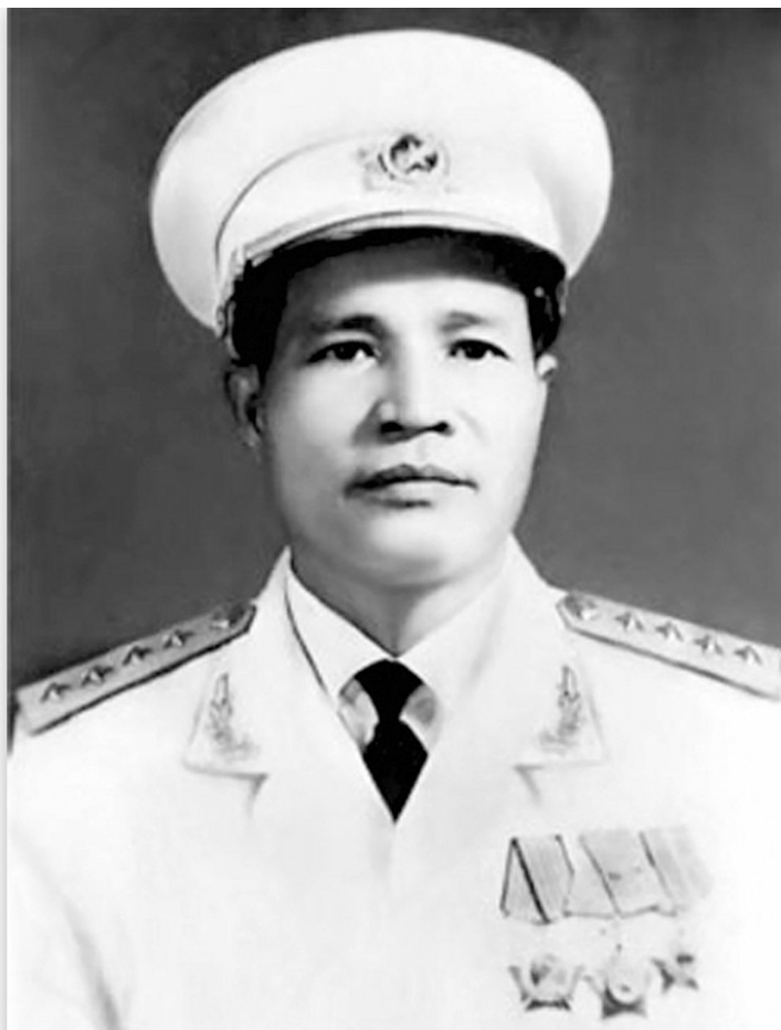
Đại tướng Nguyễn Chí Thanh