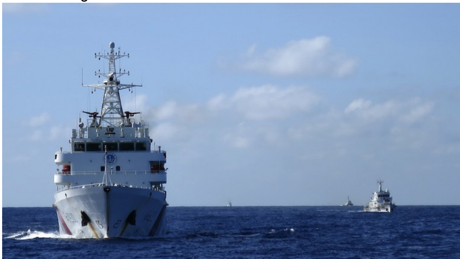
Tàu hải cảnh của Trung Quốc đuổi tàu cảnh sát biển của Việt Nam ở gần giàn khoan HD 981 ở khu vực quần đảo Hoàng Sa hôm 15/7/2014.

Trong cả hai bài trả lời phỏng vấn, ông Vịnh phần lớn đều nói theo kiểu “mười voi không được bát nước xáo”. Cũng có lúc ông “mon men” gần đến sự thật, khi ông lăn tăn: “Nếu để mất Biển Đông thì quân đội Việt Nam, các nhà lãnh đạo sẽ có tội với đất nước và cũng sẽ không yên với dân được”. Đúng vậy! Nhưng thưa vị thượng tướng đang lo chạy tội, điều này thì chính bọn cầm quyền Bắc Kinh còn biết rõ và biết sớm hơn ông.