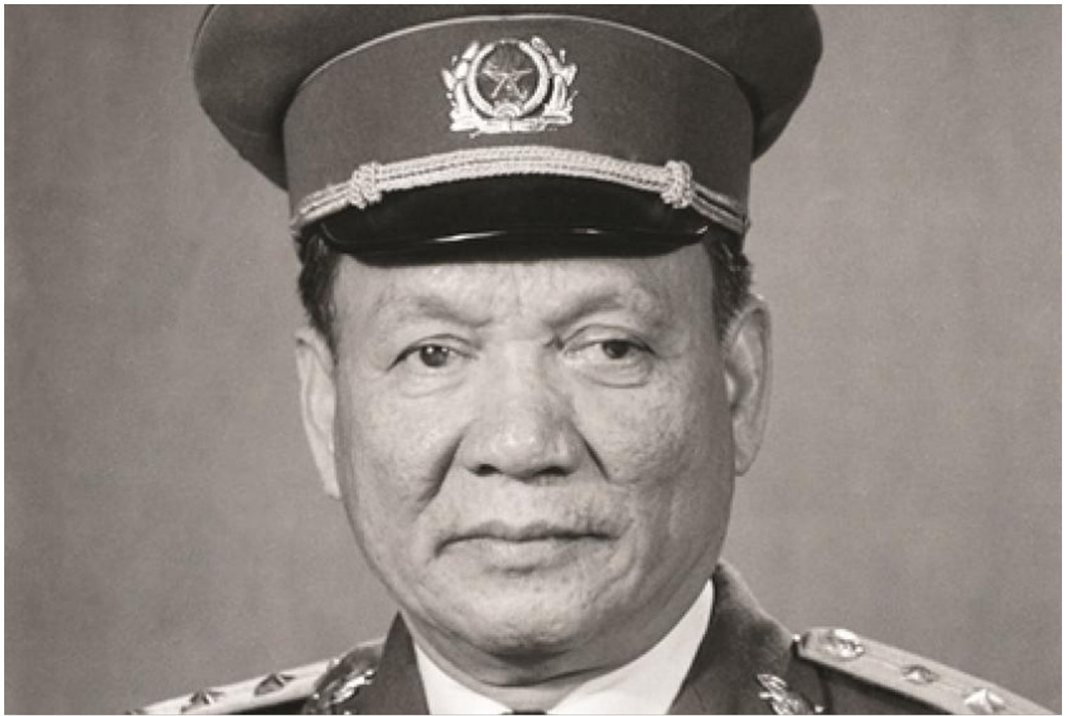
Lê Đức Anh, người nâng đỡ Nguyễn Chí Vịnh